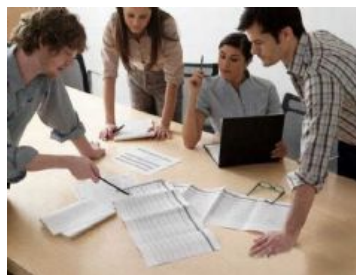
Formar emprendedores es el objetivo central del club que se lanza en agosto (foto ilustrativa)